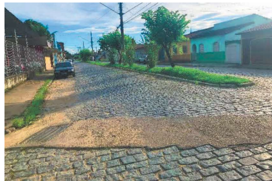
F4-Vista parcial da Avenida.