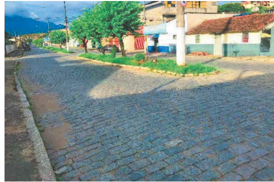
F2-Vista geral do início da Avenida