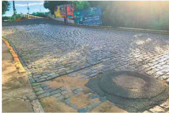
F1-Vista do início da Avenida a partir da ponte.