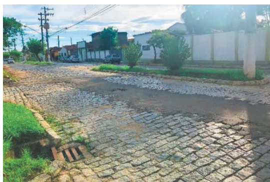
F5--Vista parcial da Avenida