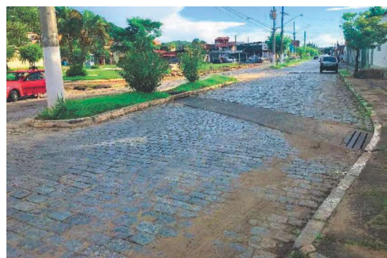
F6-Vista parcial da Avenida